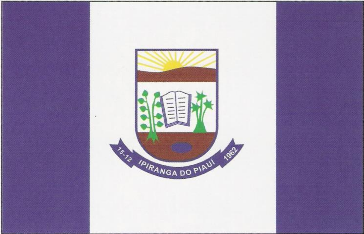
Bandeira de Ipiranga